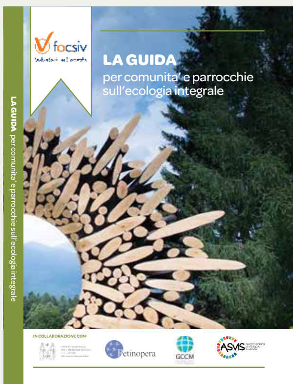
La Guida per comunità e parrocchie sull'Ecologia Integrale 2020 – FOCSIV

Per partecipare è richiesta l'iscrizione e il versamento di una quota di partecipazione di 20€ come impegno di presenza e relativo minimo sostegno ai costi del corso. Ai partecipanti oltre alle lezioni e alla interazione con i relatori verranno forniti materiali come registrazioni, slide e documenti, insieme con un attestato di partecipazione. Per ogni modulo di formazione i Media Partner indicheranno ai partecipanti alcuni testi come suggerimento per l'approfondimento e Avvenire fornirà l'accesso gratuito al giornale on line.